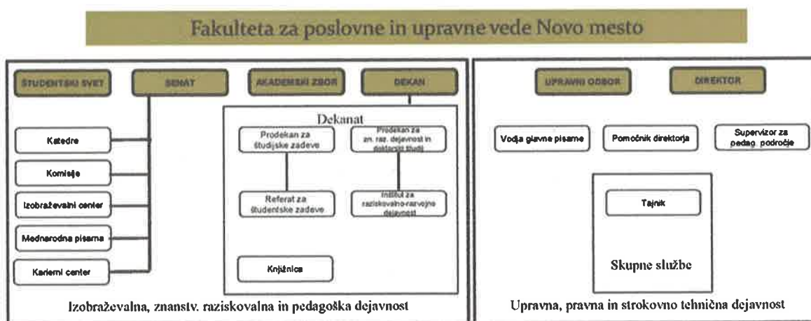
Slika 1: Organizacijska struktura

Število, vrsto in pristojnosti organov fakultete določata Zakon o visokem šolstvu in Statut fakultete, sprejet 17. oktobra 2012.