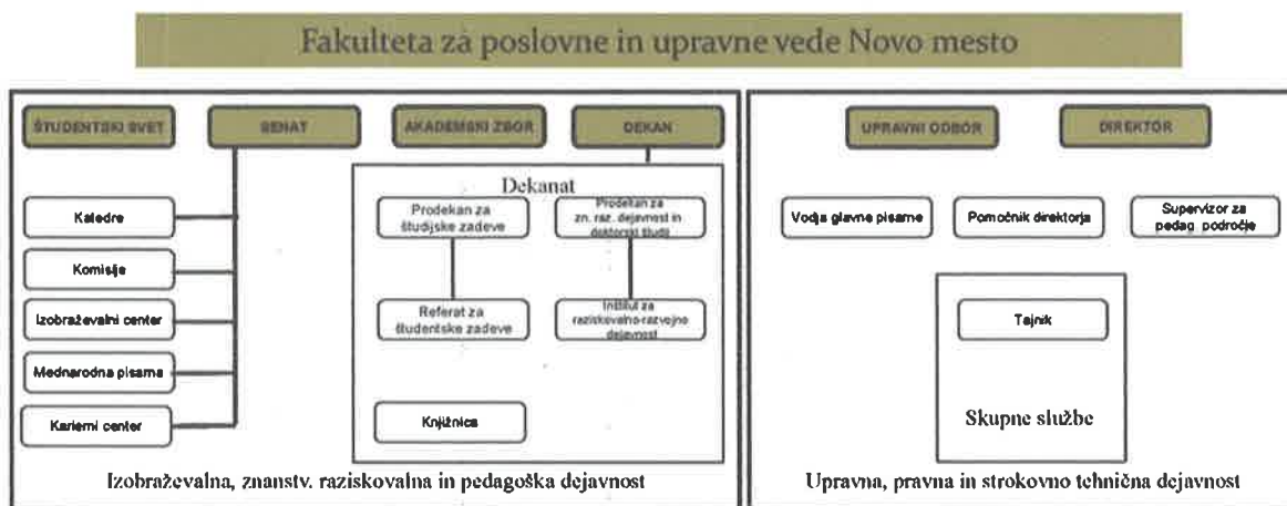
Slika 1: Organizacijska struktura

Število, vrsto in pristojnosti organov fakultete določata Zakon o visokem šolstvu in Statut fakultete, sprejet 17. oktobra 2012.